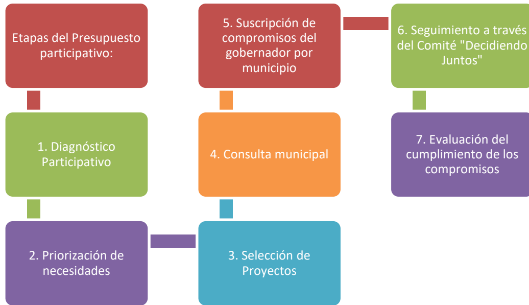
Etapas del Presupuesto Participativo, Decidiendo Juntos